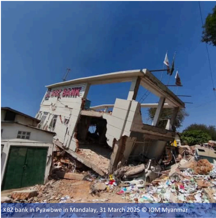
KBZ bank in Pyawbwe in Mandalay, 31 March 2025